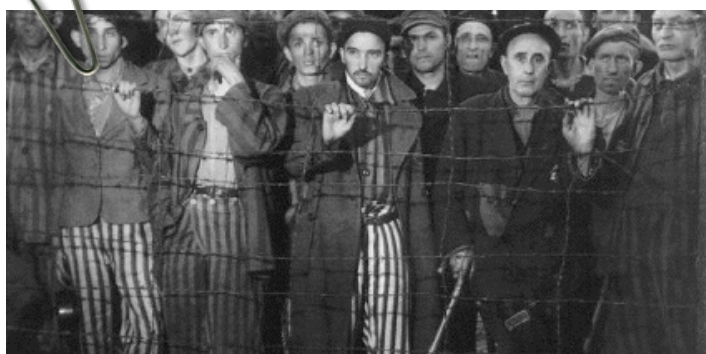
Bilder från ett förintelsläger