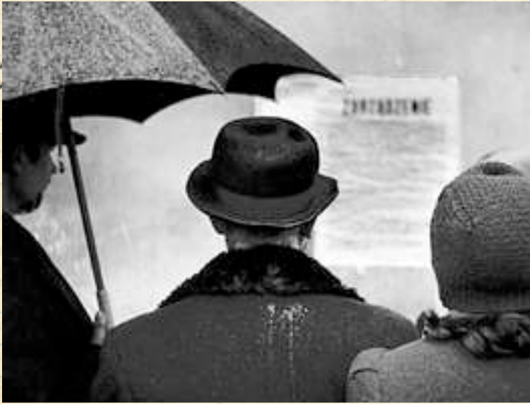
Invånare i Laboz läser affischer med information om nazisternas maktövertagande.

Familjerna Zyto Schwarz Dabrowski Taikon skall omgående flytta från sina bostäder och flytta in i gettot i stadens norra del. Ni får två dagar på er att plocka ihop era saker. Familjer som vägrar kommer att fängslas!