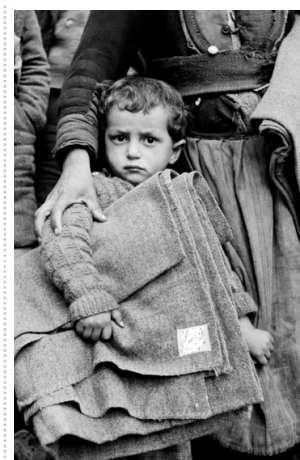
Är detta en tidstypisk bild?