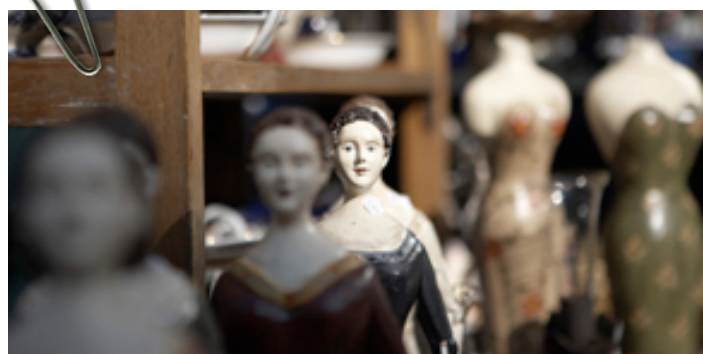
Kan detta ha varit någons leksaker?

Storyline är en metod som innebär att vi tillsammans skapar familjernas livshistoria med hjälp av historiska fakta. Till vår hjälp kommer vi under detta tema skapa hemsidor för våra familjer.