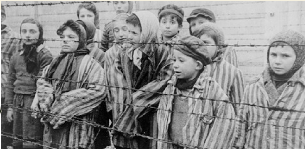
Bild från ett av nazitysklands förintelsläger