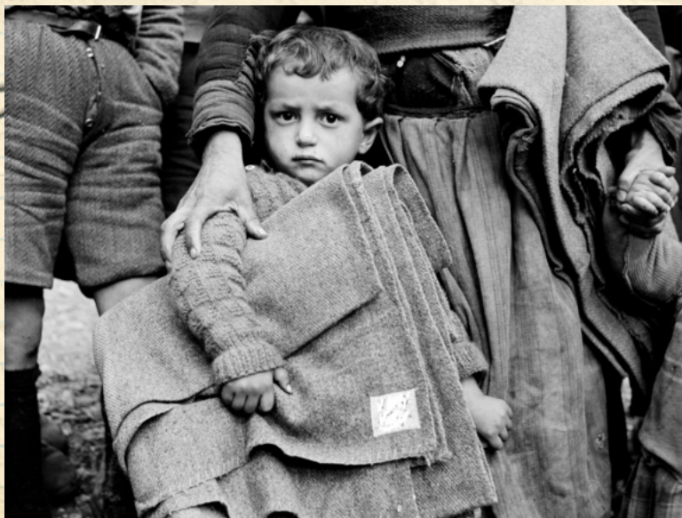
Den sista resan...

Här kan ni läsa vad som händer med er familj. Historien är påhittad, men ändå sann. Det fanns med stor sannolikhet en familj som denna under tidsperioden