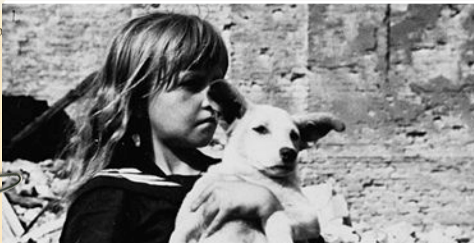
Flicka i Laboz