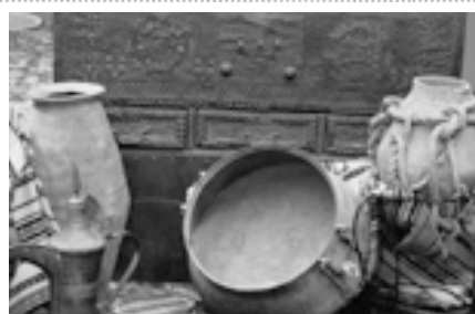
Är detta krukor som man lagade mat i?