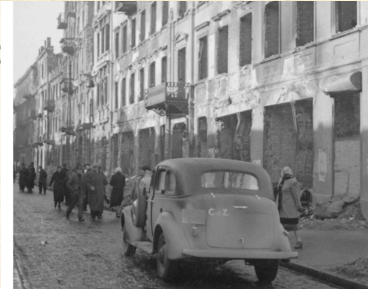
Dåliga nyheter, under hösten 1939 invaderar Tyskland Polen

En ny tid har börjat, det är en tid som kommer att bli svår och tuff för en del av familjerna i Laboz. Andra kanske får det lite lättare - eller?