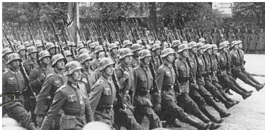
Tyskland invaderar Polen 1 september 1939