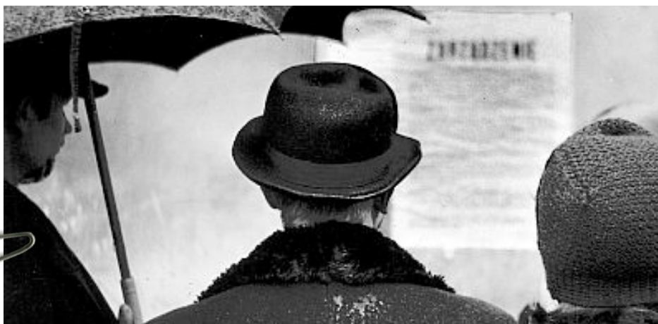
Kan detta föreställa befolkningen i Laboz?