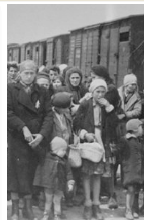
På väg till "lägret" vid Porslinsfabriken