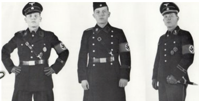
Exempel på SS uniformer